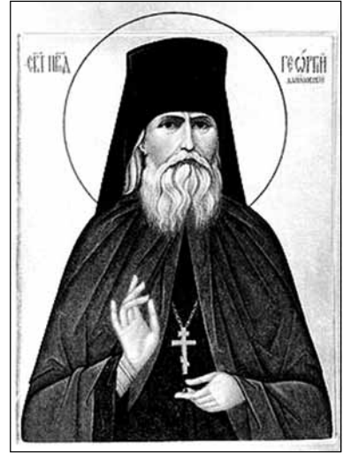
Преподобный Георгий Даниловский, исповедник

Нужно больше обратить внимание на другое: у него уже десять лет пост, а не шесть, десять, двенадцать часов. Вся ситуация, в которой он находится, — это пост. Нужно иметь к человеку большее снисхождение. Или, например, принял человек Крещение в тюрьме, а причаститься не может. А тут опасность еще в том, что он может не дожить до следующего прихода священника. Поэтому я, пользуясь случаем, ходатайствую перед теми священниками, которые служат уже в зонах, в колониях, чтобы они к этому