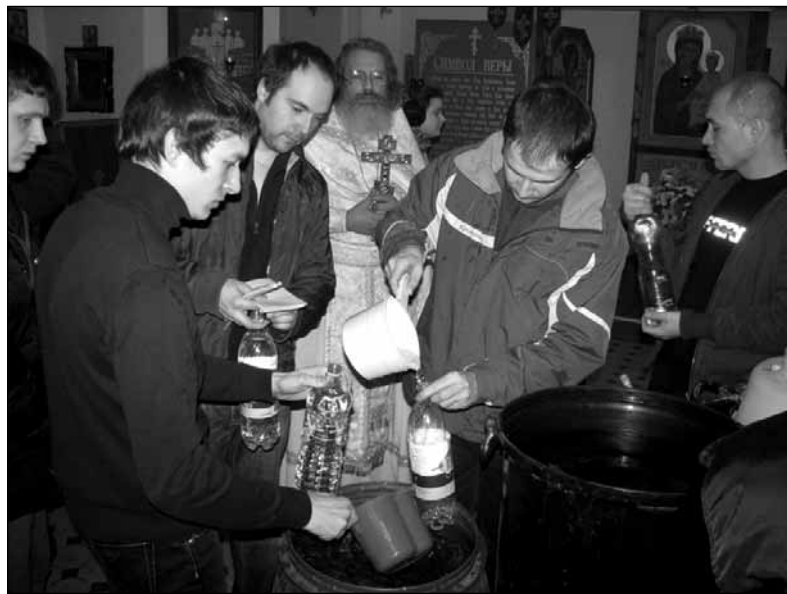
Праздник Богоявления в Бутырском изоляторе

Конечно, была и другая сторона: были следователи, пытки. Это не были контролеры, это НКВД, он