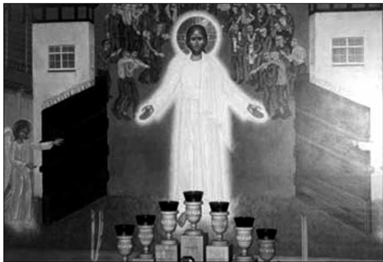
Алтарная икона Свято-Воскресенской часовни «Воскресший Спаситель освобождает заключенных концентрационного лагеря Дахау»