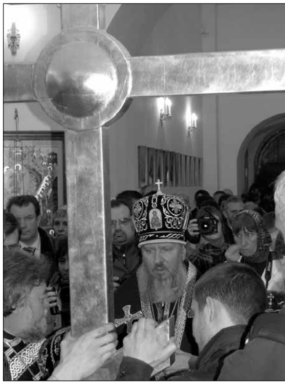
Освящение купольного креста