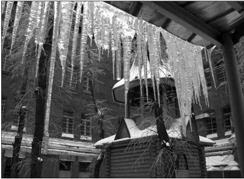
Колокольня Покровского храма

— В Воронеже есть реабилитационный центр: человек выходит на свободу и попадает в реабилитационный центр, но уже с той стороны колючей проволоки. И осужденный, когда освобождается, сразу далеко не уходит от колонии, а какое-то время пребывает там.