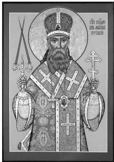
Священномученик Петр Крутицкий

Интервью с о. Константином Кобелевым, старшим священником СИЗО № 2 «Бутырка»