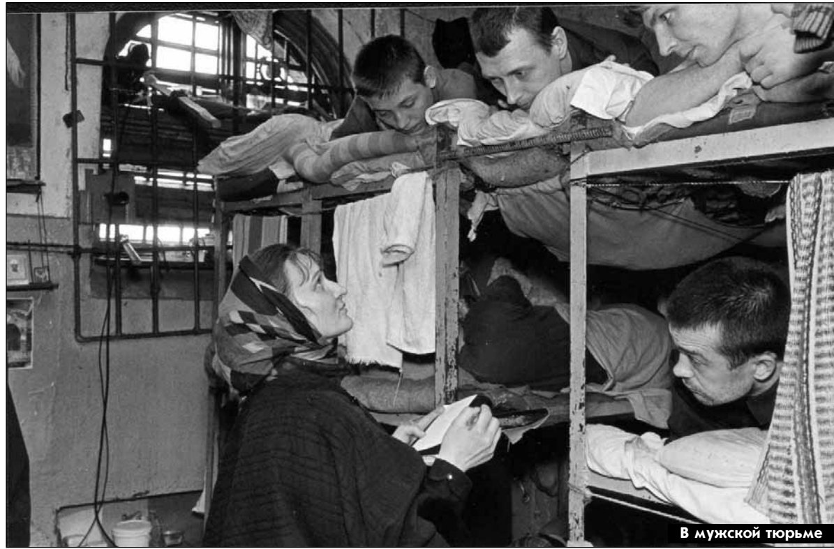
В мужской тюрьме

изучить историю Церкви или другие церковные дисциплины.