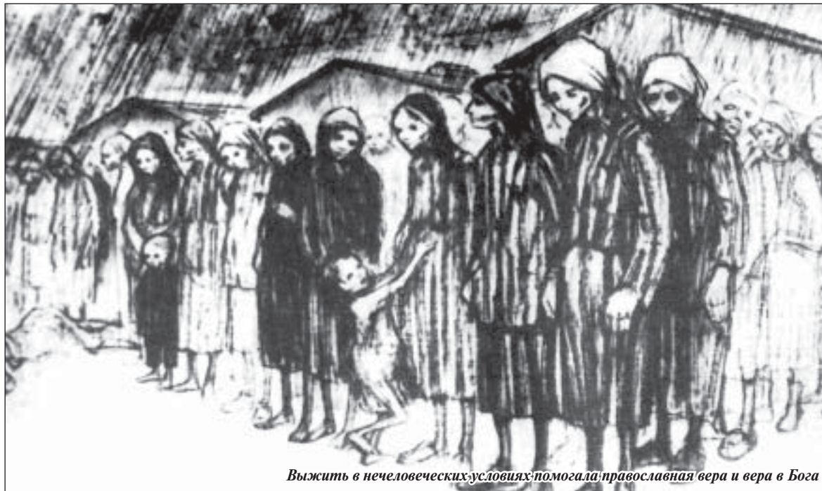
Выжить в нечеловеческих условиях помогла православная вера и вера в Бога