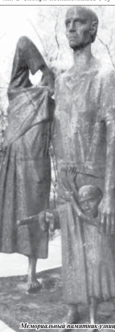
Мемориальный памятник узницам Равенсбрюка