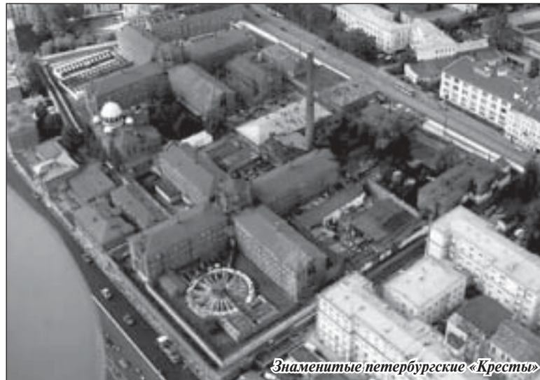
Знаменитые петербургские «Кресты»