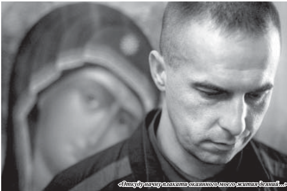
«Откуда начну, какати, окаянного моего жития Десяний...»

Таким образом, за девять лет нашей работы были составлены курсы обучения для людей разной степени воцерковленности. Кроме того, в прошлом году закончен сборник