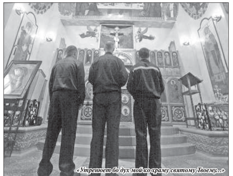
«Утреюет бо дух мой ко храму святому Твоему...»

это были олимпиады по православным праздникам, потом обучение по Закону Божьему и по методикам для детской колонии. Теперь обучение проходит по новому курсу: «Толкование посланий святых апостолов» на основе книг архиеписко-